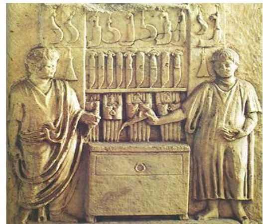
Utensilios medicina antigua